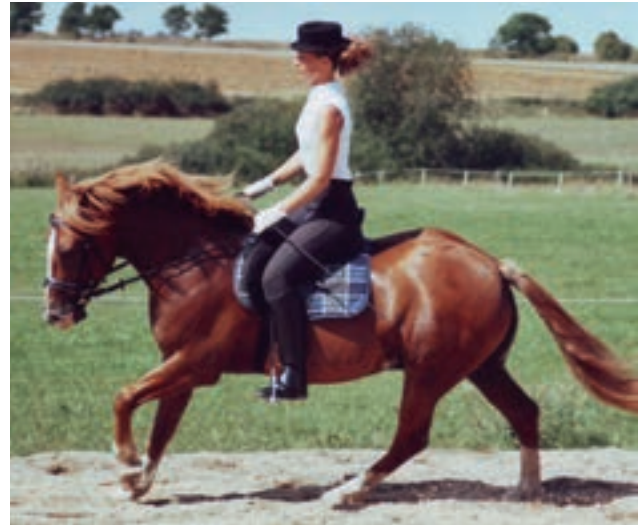
oben: Deutlich erkennbar ist die Rahmenerweiterung.

Übergänge zwischen den Gangarten oder auch zwischen den Tempi innerhalb einer Gangart sind eine wichtige gymnastizierende Übung. Sie fördern und fordern die Durchlässigkeit des Pferdes, kräftigen die Hinterhand, dienen der Schwungentwicklung und wirken versammelnd. Jeder Übergang muss von hinten nach vorne geritten werden: Sowohl beim Übergang in eine höhere Gangart bzw. ein höheres Tempo als auch beim Übergang in eine niedrigere Gangart bzw. ein niedrigeres Tempo hält der Reiter das Pferd vor allem an den treibenden Hilfen und aktiviert die Hinterhand. Bei übermäßiger Handeinwirkung bzw. fehlenden treibenden Hilfen fällt das Pferd beim Übergang in ein niedrigeres Tempo schnell auf die Vorhand, beim Übergang in ein höheres Tempo häufig auseinander, d.h. die Hinterhand tritt nicht mehr unter den Schwerpunkt. Bei einem fließenden Übergang bleibt eine gleichmäßig, ruhige und elastische Anlehnung erhalten.